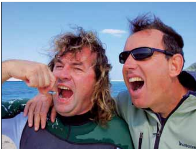
ROBERT E VASCO RENNA

Non bisogna aspettarsi la vita notturna di Hurghada, ma credo che Safaga sia un'ottima scelta per chi vuole fare windsurf un po' a tutti i livelli, perché anche i principianti trovano il loro momento nelle vicinanze del centro Vasco Renna, che si trova leggermente più a ridosso. La città di Safaga è molto divertente da visitare, perché vi potete godere l'Egitto nella sua forma più semplice...con bancarelle lungo la strada, e la tipica vita egiziana!